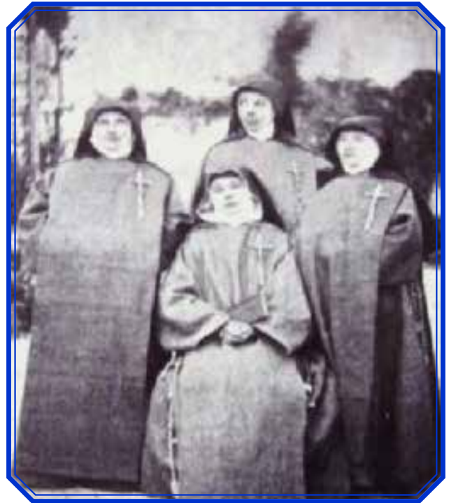
Comme PROCURATEUR général de l'ORDRE OFM