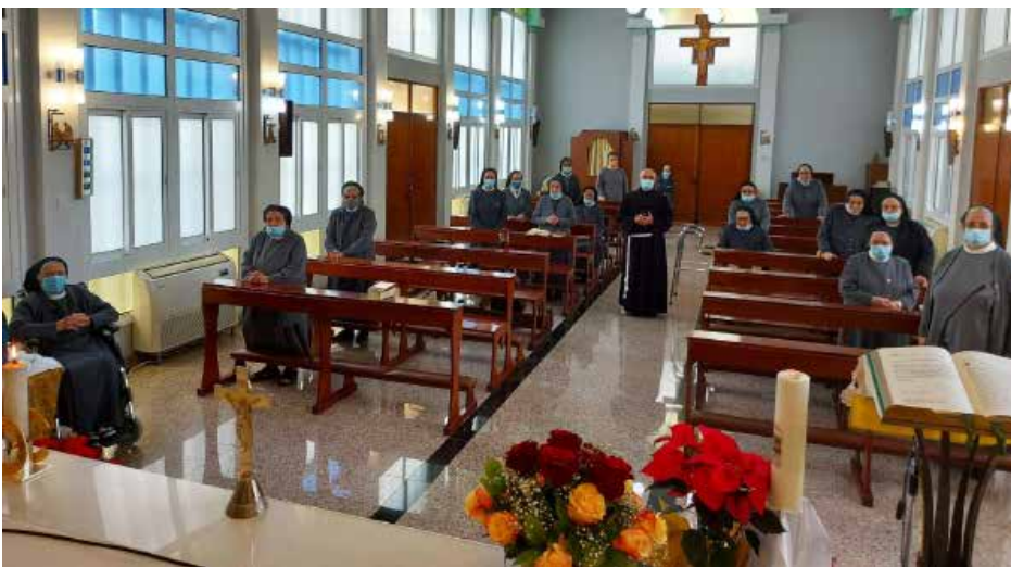
Début de la retraite et... début de l'expérience contagieuse du Covid 19

Il n'était pas facile de maintenir les religieuses âgées immobiles et isolées, accrochées à la vie communautaire et se déplaçant ici et là pour continuer à assurer correctement leurs services. Dans un certain sens, nous avons vécu une pauvreté jamais imaginée auparavant: nous éloigner, nous priver des relations et d'affections, communiquer à travers la porte fermée, porter toujours le double masque qui empêche les expressions verbales, éprouver la peur extrême de la contagion.