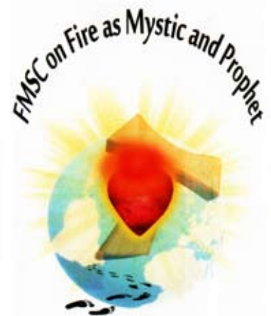
3rd Provincial Chapter 2012 Holy Family Province, India

Franciscane Missionarie del Sacro Cuore ardenti nella mistica e profezia per la costruzione di una nuova umanità