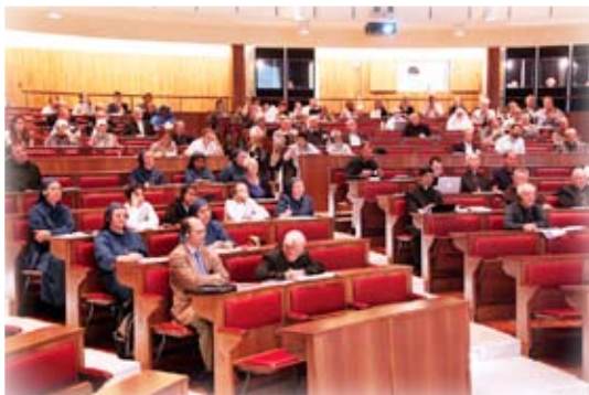
figura della Madre di Dio, ma costituisce l'orizzonte ermeneutico essenziale per ogni ulteriore riflessione, sia di carattere teologico, sia di carattere più pienamente spirituale e pastorale".

Il momento culminante del Congresso è stato vissuto nella mattinata di sabato 8 settembre, con l'udienza concessa da Benedetto XVI nella residenza di Castel Gandolfo. Il Santo Padre, durante il discorso rivolto ai presenti, ha sottolineato, riferendosi al capitolo VIII della Lumen Gentium, che "il testo conciliare non ha esaurito tutte le problematiche relative alla